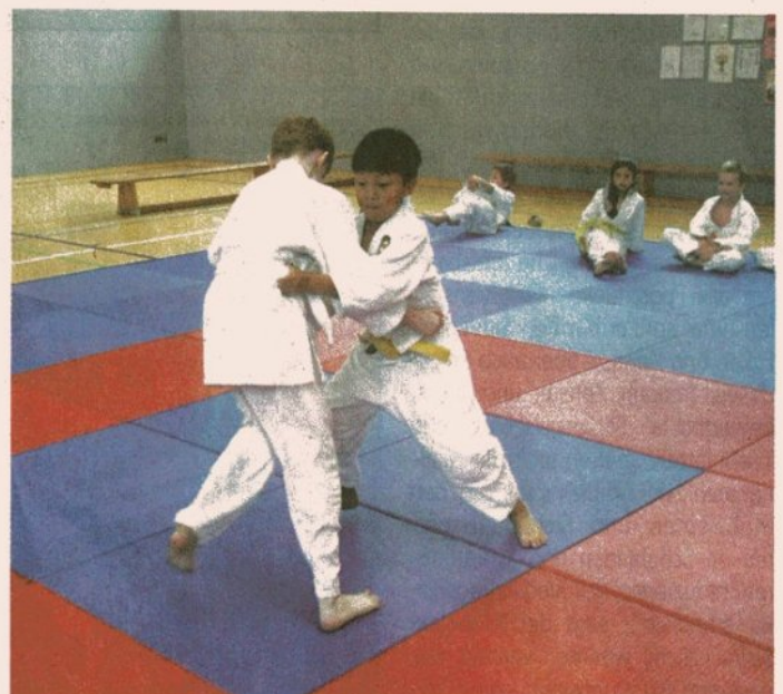
Beim Sumo konnten viele Punkte erreicht werden