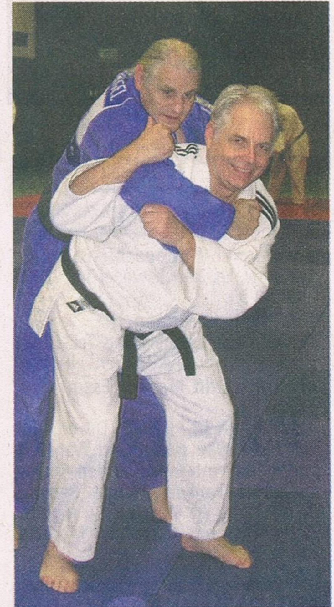
Beim Üben des Schulterwurfes im Training